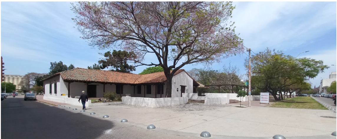
Museo Histórico Provincial

Ver Anexo 8. Inventario. 200 obras del patrimonio Arquitectónico de Santa Fe. Ficha 003