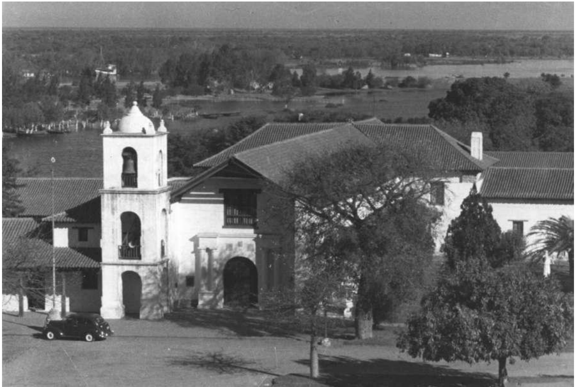
Vista del complejo restaurado a su arquitectura original colonial.

La iglesia se terminó de construir en 1688 y posteriormente se completaron los claustros. El complejo pertenece al tipo de arquitectura hispana, caracterizada por gruesos muros de tapia, techumbre de teja canal sobre estructura de madera, y una fuerte volumetría blanqueada, en la que se destaca el campanario que se adelanta a la fachada principal, profundizada por un techo cobijo, solución