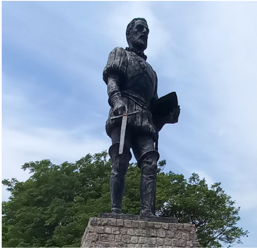
Monumento Juan de Garay

Entre otros elementos escultóricos que ocupan el actual Paseo, el más destacado por su impronta y su relevancia cívica es el monumento a Juan de Garay, fundador de la ciudad. Fue erigido en 1980.