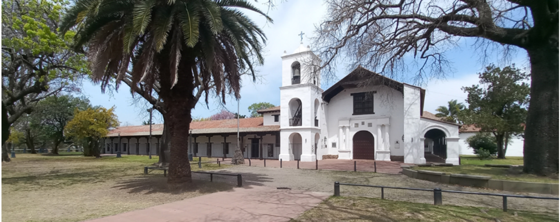
Iglesia y convento de San Francisco

semejante a otras arquitecturas coloniales en el noroeste del país. En su interior se destaca la cubierta de la nave principal, realizada mediante la técnica de par y nudillo con maderas procedentes del Paraguay, enlazando así dos tecnologías propias de distintas regiones. El edificio es Monumento Histórico Nacional y posee en su ala norte un museo alegórico a los Constituyentes de 1953.