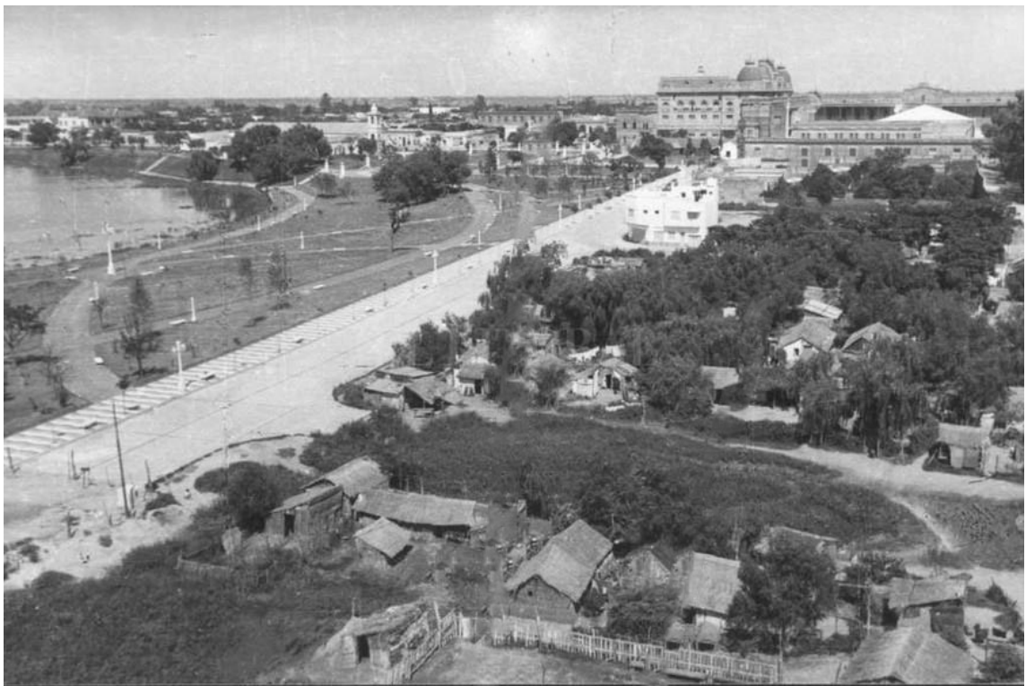
Vista del parque Manuel Belgrano luego de su inauguración. Al fondo se observa el Edificio de Casa de Gobierno y en primer plano la prolongación de la calle 3 de Febrero y el Lago del Parque por detrás.

En ese tiempo, a su vez, el arroyo El Quillá es separado del sistema hídrico natural, pasando a conformar un lago, sin conexión directa con el sistema hídrico del río Paraná.