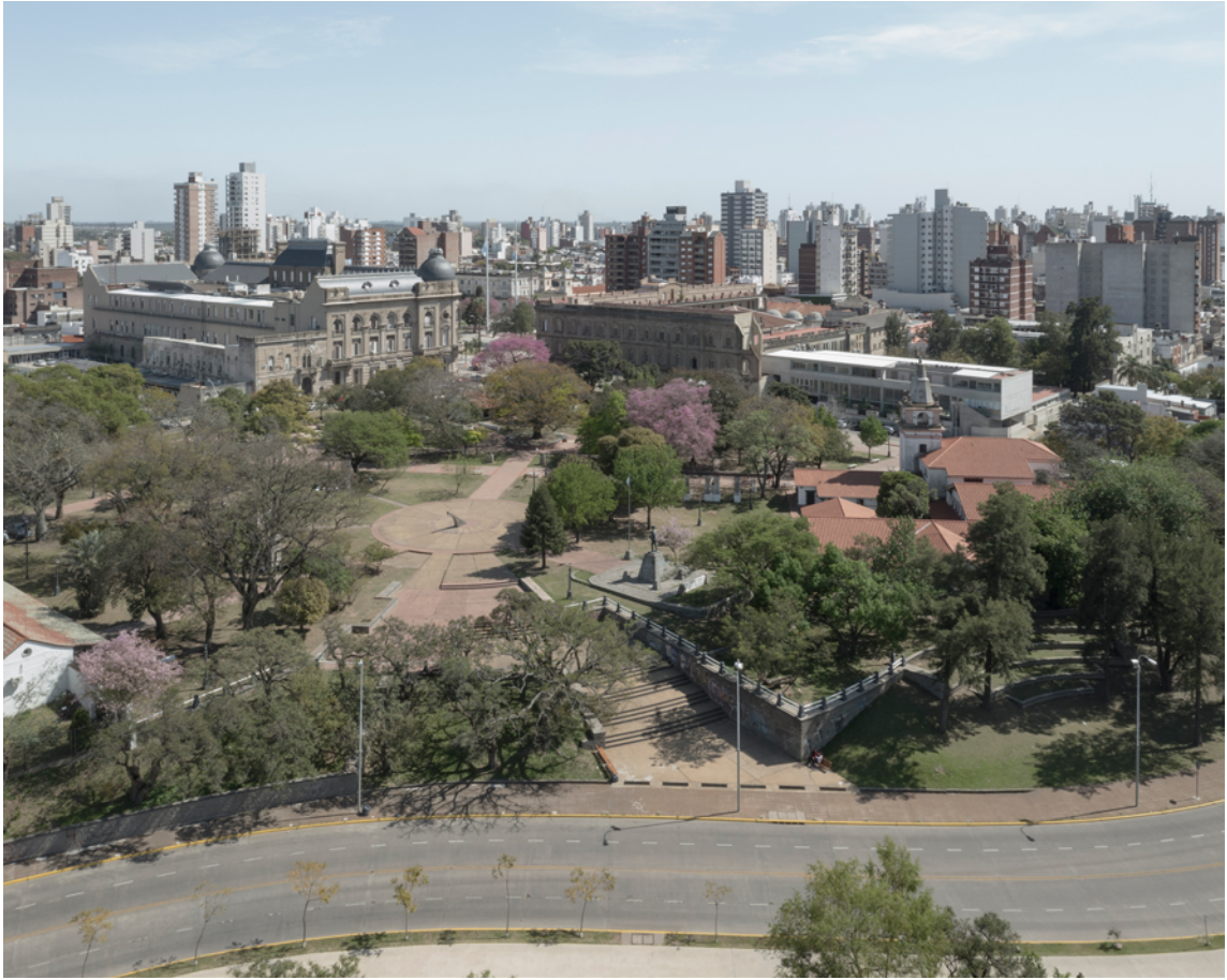
Vista área del paseo

El predio a intervenir se encuentra ubicado en la zona sur de la ciudad de Santa Fe. Se trata de un área de parque peatonal que ocupa la manzana delimitada al Norte por la Calle 3 de Febrero; al oeste por la Calle San Martín; al este y sur por la Avenida Carlos Sylvestre Begnis y al sur por la calle Entre Ríos. En su interior aloja tres complejos edilicios de alto valor patrimonial. El conjunto del Convento Franciscano (Ver Anexo 8. Inventario. 200 obras del patrimonio Arquitectónico de Santa Fe. Ficha 001), conformado por Iglesia, convento y escuela, en el sector sur del área; el Museo Histórico Provincial (Ver Anexo 8. Ficha 003) en la intersección de las calles San Martín y 3 de Febrero; y el Museo Etnográfico Provincial (Ver Anexo 8. Ficha 131) en la esquina de las calles 3 de Febrero y Sylvestre Begnis.