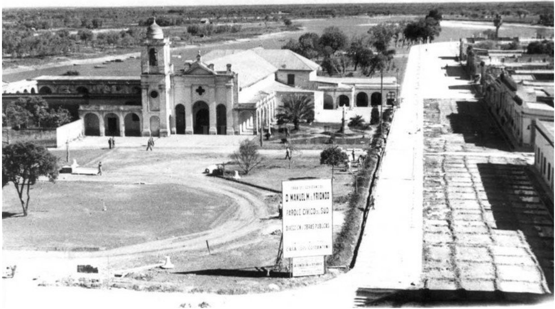
El complejo edilicio de la Iglesia y el convento Franciscano, previo a su restauración al original colonial

Ver Anexo 8. Inventario. 200 obras del patrimonio Arquitectónico de Santa Fe. Ficha 001