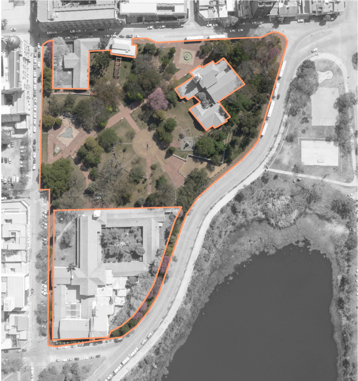
Área de intervención

La manzana tiene un área total de 31.000 m 2 incluyendo veredas. La propuesta de concurso deberá limitarse a los espacios señalados en la documentación digital como Área de intervención, en la que se excluyen los edificios patrimoniales, la escuela y sus áreas de uso privado, resultando en una superficie de intervención de 21.300 m 2 .